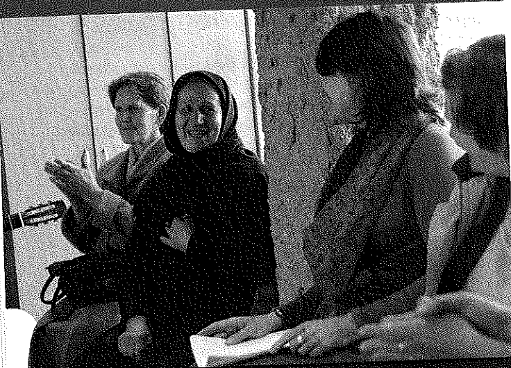
De Nederlandse zangeressen met de vrouwen van Srebrenica.

WERELDPROJECT Nieuws uit de wereld van het goede doel Zingen om te verwerken